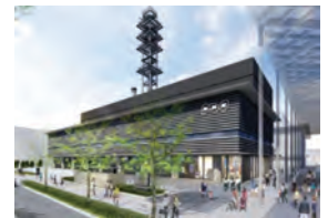
奈良放送会館完成イメージ