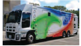
スーパーハイビジョン中継車