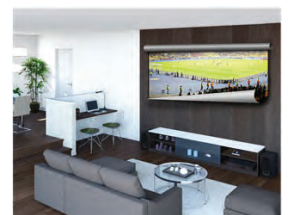
8 Kシート型ディスプレイの研究