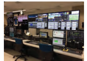
地域局番組送出設備