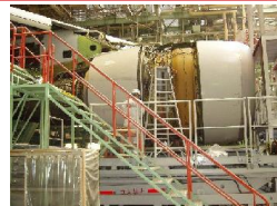
【航空機の修理・改造】