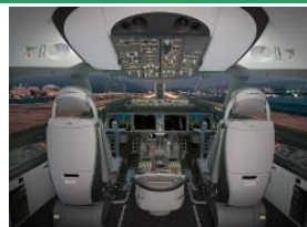
【高度化した操縦システム】